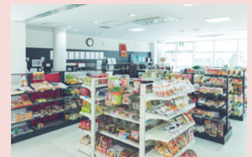
③ みんなのお店やまくに