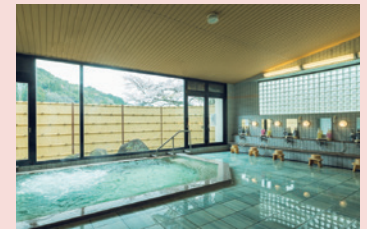
② やすらぎの郷やまくに