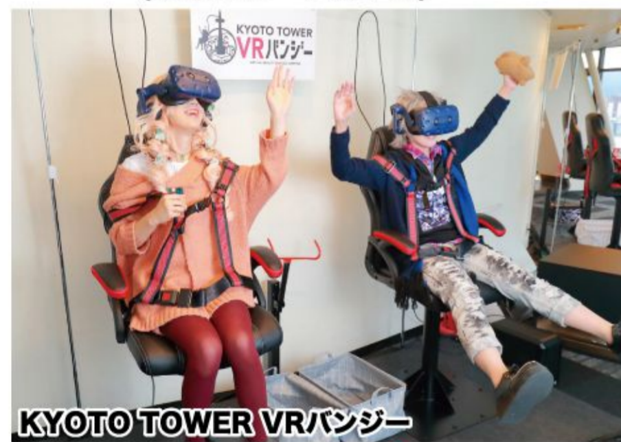
スカイラウンジ「空」-KUU- (展望室 3F)