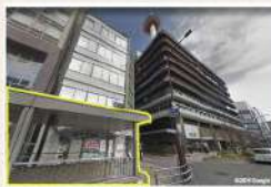
B13 京都タワー西側入り口に 一番近い出入口です。