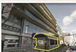
C7 受付・更衣室への往来に便利です。