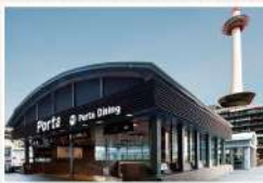
B7 京都駅中央口目の前の出入口です。