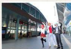
C1 京都駅南北自由通路目の前の 出入口です。