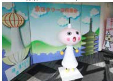
スカイラウンジ「空」-KUU- (展望室 3F)