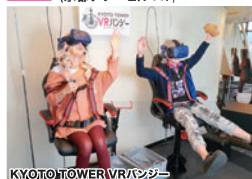
KYOTO TOWER VRハンズ