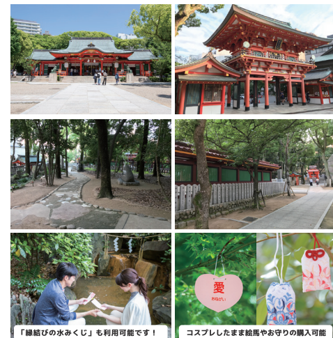
「縁結びの水みくじ」も利用可能です！ コスプレしたまま結馬やお守りの購入可能